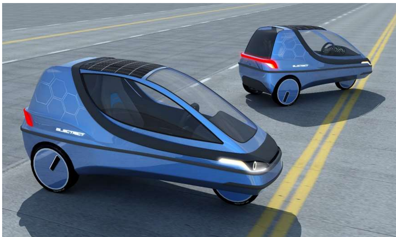
Projekt modernizacji trójkołowego pojazdu elektrycznego dla Hoverjet i Heron Electric