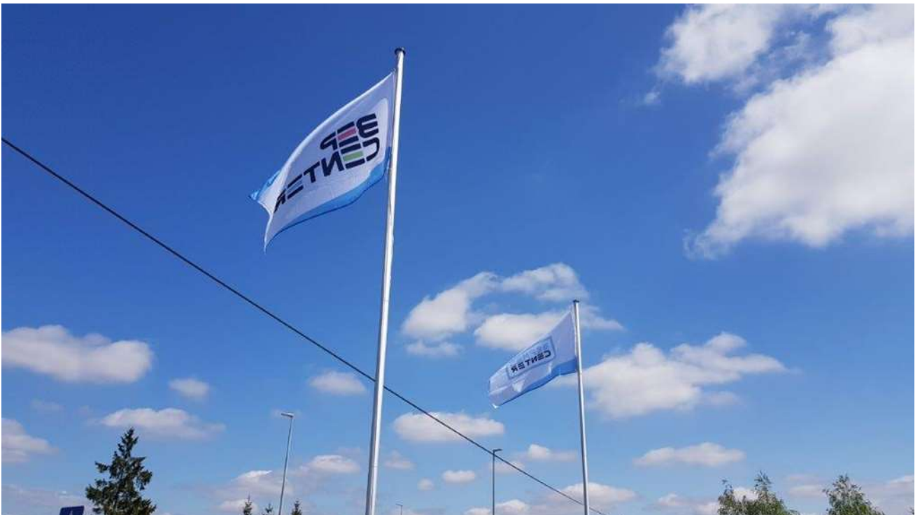
Źródło własne - Biomass Energy