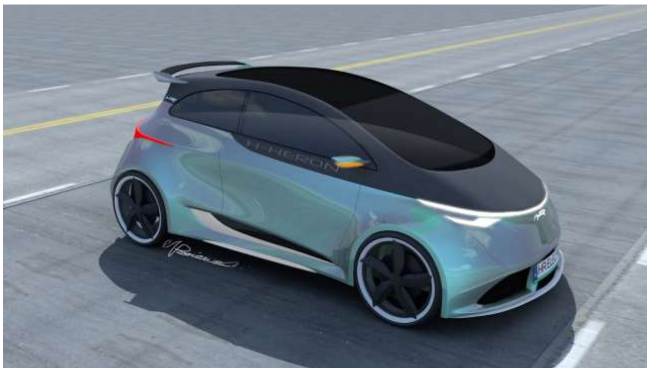
Projekt samochodu osobowego z napędem elektrycznym dla Heron Electric S.A