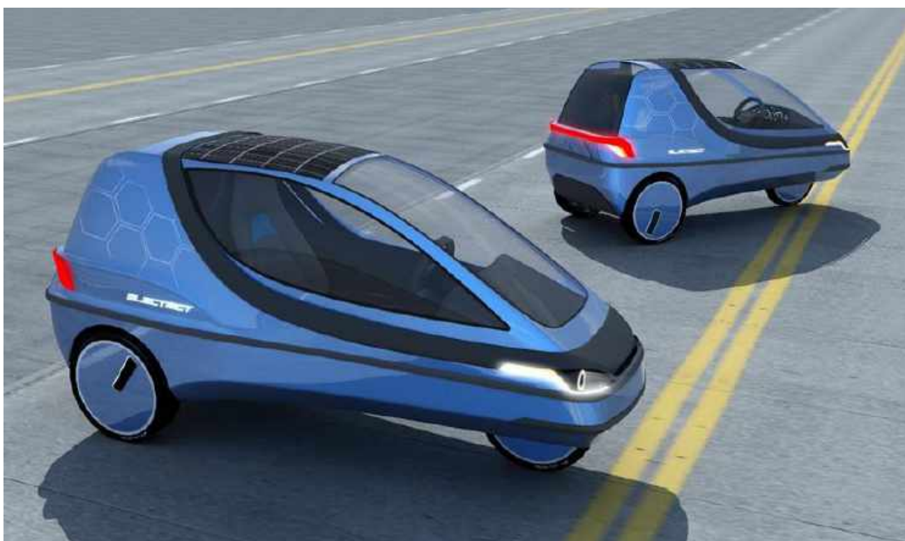
Projekt modernizacji trójkołowego pojazdu elektrycznego dla Hoverjet i Heron Electric