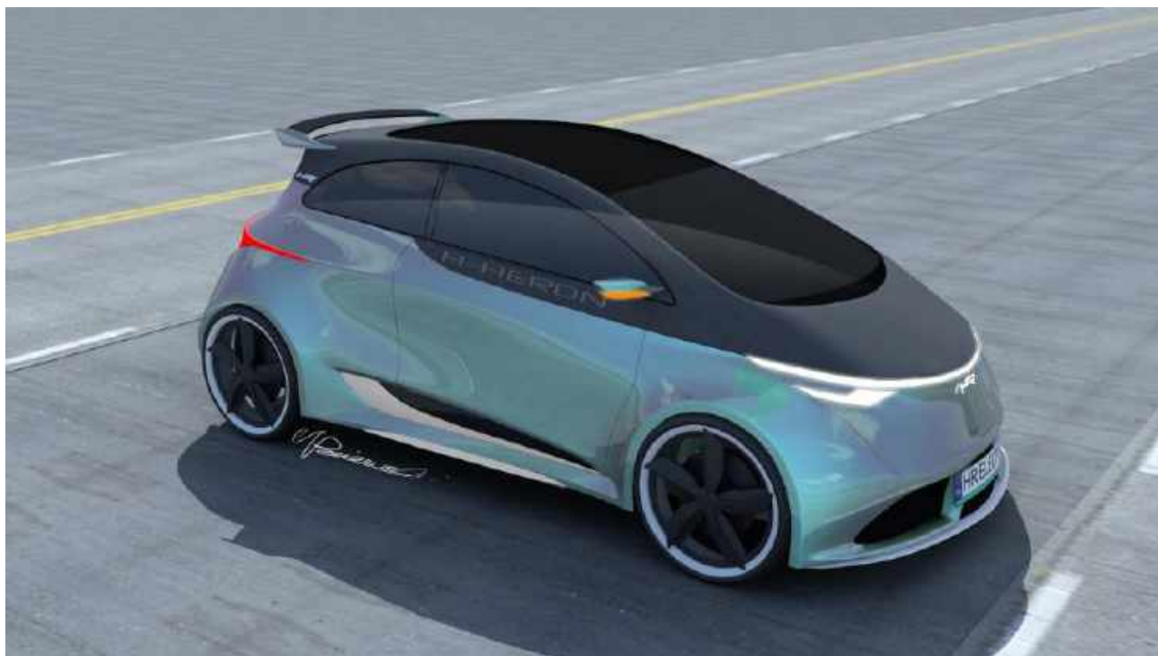
Projekt samochodu osobowego z napędem elektrycznym dla Heron Electric S.A